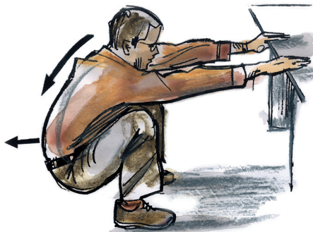
protážení v podřepu